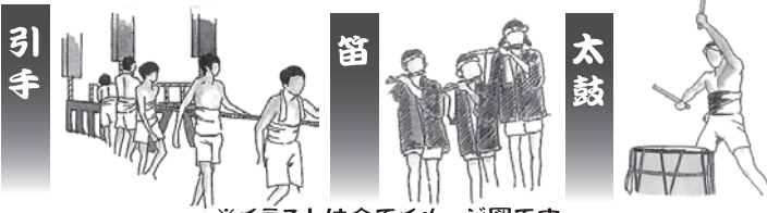
※イラストは全てイメージ図です。