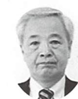
二号議員 (常議員) 與語 忠道 能代運輸㈱