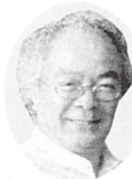
一号議員 西方 里見 南西方設計