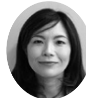
事務 関 加奈子

当所職員ならびに共済業務の委託者でありますアクサ生命担当者が訪問した際には、何卒よろしくお願ひ申し上げます。