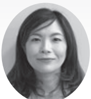
事務 関 加奈子

当所職員ならびに共済業務の委託者でありますアクサ生命担当者が訪問した際には、何卒よろしくお願ひ申し上げます。