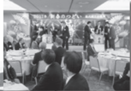
2017年開催のようす。会員をはじめ、地元行政、経済界などから約300名の方にご参加いただきました。