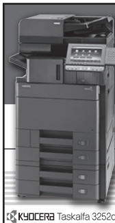
KYOCERA Taskalfa 3252ci