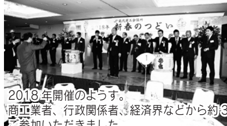
2018年開催のようす。 商工業者、行政関係者、経済界などから約300名の方にご参加いただきました。