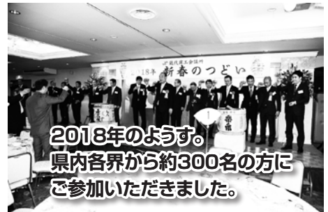
2018年のようす。 県内各界から約300名の方 にご参加いただきました。