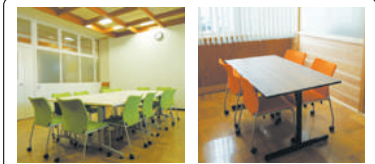
コミュニティルーム