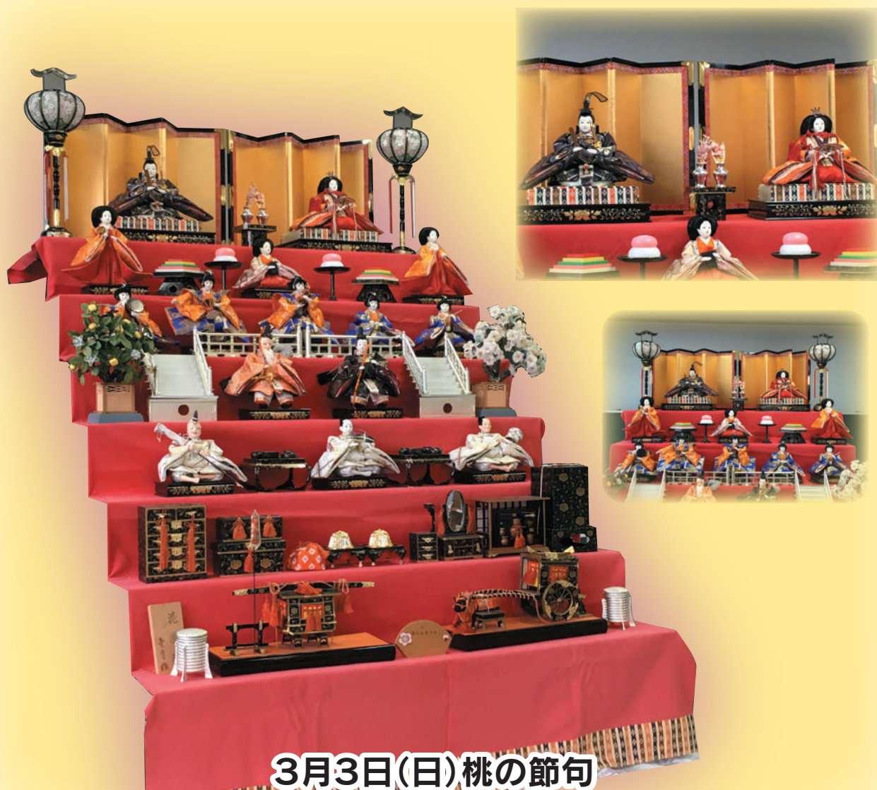
3月3日(日)桃の節句 能代市立湊城南小学校に飾られているひな人形