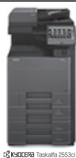
KYOCERA Taskalfa 2553ci