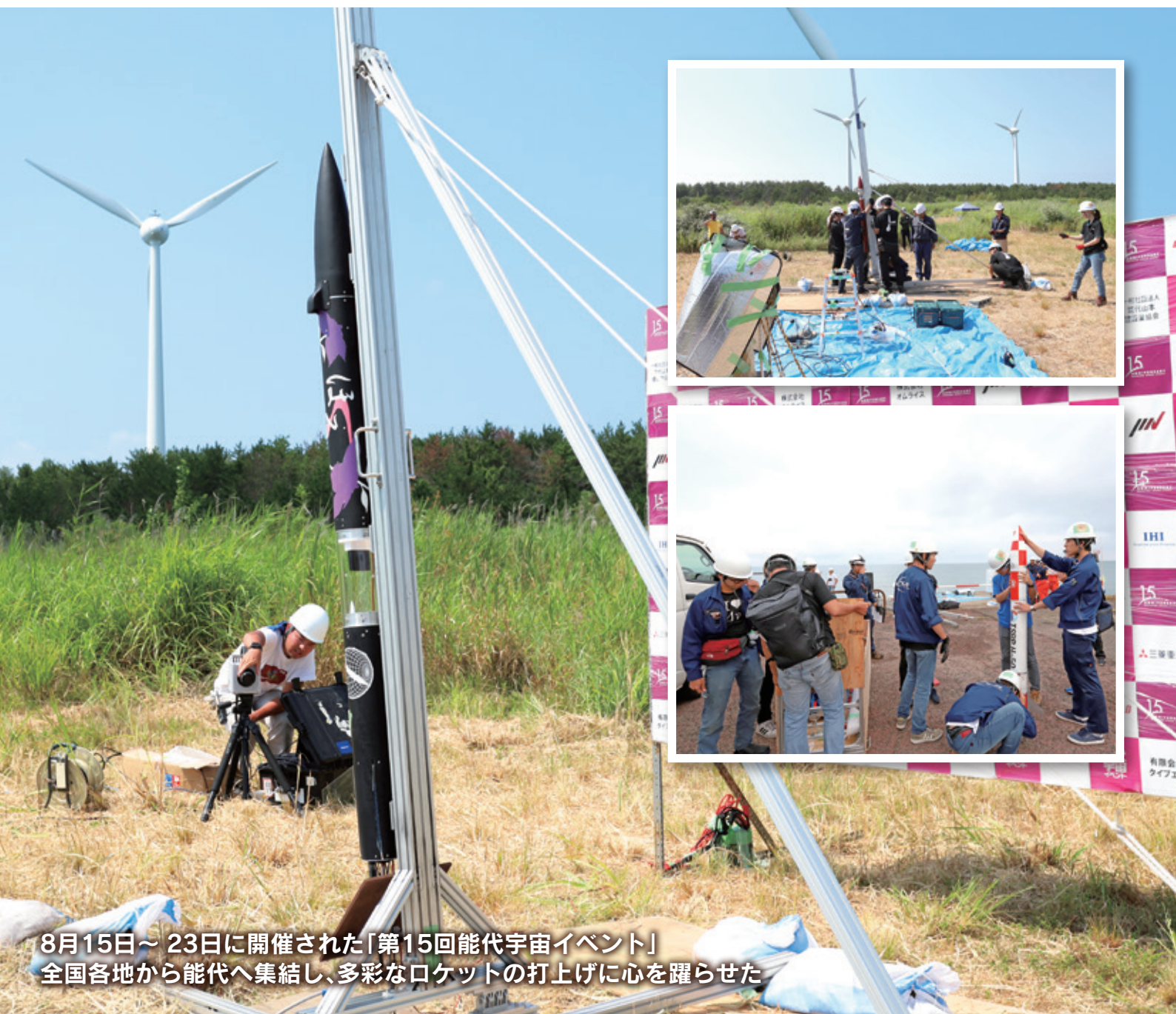
8月15日～23日に開催された「第15回能代宇宙イベント」 全国各地から能代へ集結し、多彩なロケットの打上げに心を躍らせた