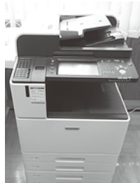
カードタッチ式複合機