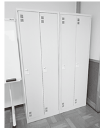
ロングコートが入るロッカー