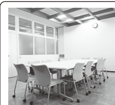
コミュニティルーム