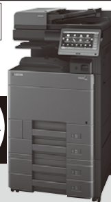
KHDCERA Taskalfa 2553ci

●業務用コンピュータ ●業務用ソフト ●中古複合機 ●モノクロ・カラー複合機 ●ネットワークカメラなど