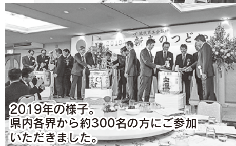
2019年の様子。 県内各界から約300名の方にご参加いただきました。