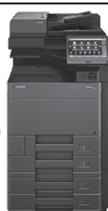
●K910CERB Taskalfa 2533C1