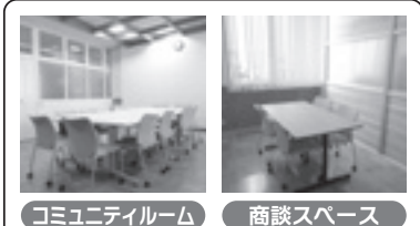
コミュニティルーム

室内には、FAX電話、商談スペースや専用ロッカー、専用ポスト等の設備を完備し、隣室にはコミュニティルームもあります。