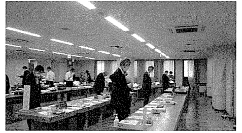
<昨年度の審査風景>