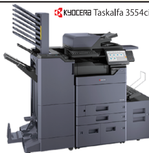
KYOCERA Taskalfa 3554ci