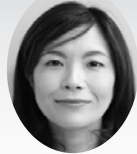
事務 関 加奈子

当所職員ならびに共済業務の受託者でありますアクサ生命 担当者が訪問した際には、何卒よろしくお願ひ申し上げます。