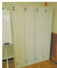
個別専用ロッカー