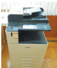
カードタッチ式 複合機