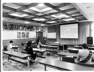
第53回全国商工会議所女性会連合会 オンライン総会 2021年10月22日(金)