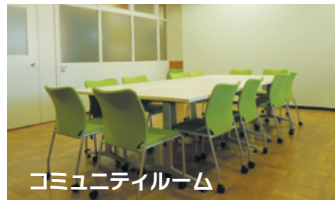
コミュニティルーム

室内には、FAX電話、商談スペースや専用ロッカー、専用ポスト等の設備を完備し、隣室にはコミュニティルームもあります。