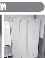
個別専用ロッカー