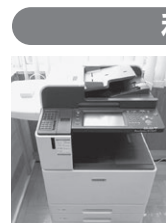
カードタッチ式複合機