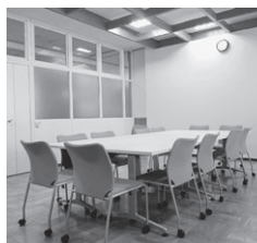
コミュニティルーム