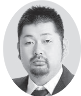
一号議員 ラーメン哲学 飯 坂 隼